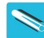
Centralne ogrzewanie i ciepła woda użytkowa