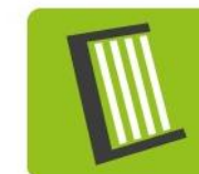
OZE: mikroinstalacje fotowoltaiczne i kolektory słoneczne