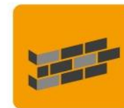
Ściany zewnętrzne oraz wewnętrzne, oddzielające pomieszczenia ogrzewane od nieogrzewanych