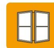
Stolarka okienna i drzwiowa