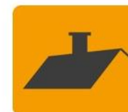
Dach lub strop