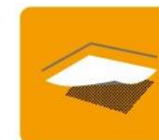
Strop nad nieogrzewaną piwnicą, podłoga na gruncie